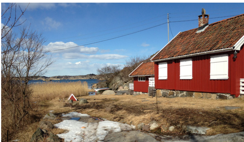
Norges Hytteforbund får stadig henvendelser fra fortvilte hytteeiere som har meldt flytting og har bodd på hytta i en årrekke, enkelte i så lenge som 15 år.

Kommunene på sin side har ikke opplyst om at man må søke bruksendring. Det er nemlig det loven krever for å kunne bo på hytta. Kommunen får inn skattepenger, men har unnlatt å informere om at hytteeieren bor på hytta ulovlig. Det har de nemlig plikt til å gjøre, i flg. Lov om behandlingssaker (forvaltningsloven) – Lovdata