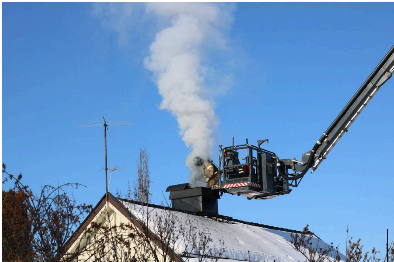
Med riktig fyring unngår du pipebrann.