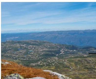
Arealet som er satt av til fritidsboliger er fire ganger størrelsen til Mjøsa.

Vi har i dag 445 513 hytter. Hvor mange hytter kan bygges innenfor området som er satt av til fritids-