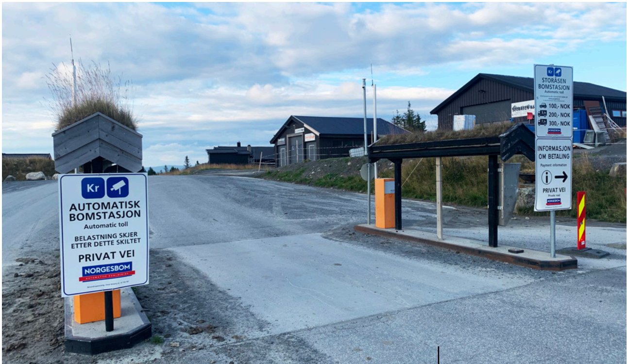
De nye automatiske bomstasjoner med skiltavlesning er god butikk for grunneierne.